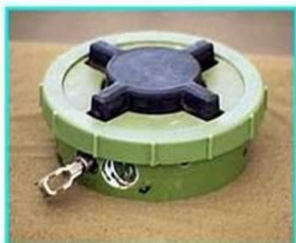
Рис.1 Общий вид мины ПМН-2

ПМН-2 Противопехотная мина нажимного типа