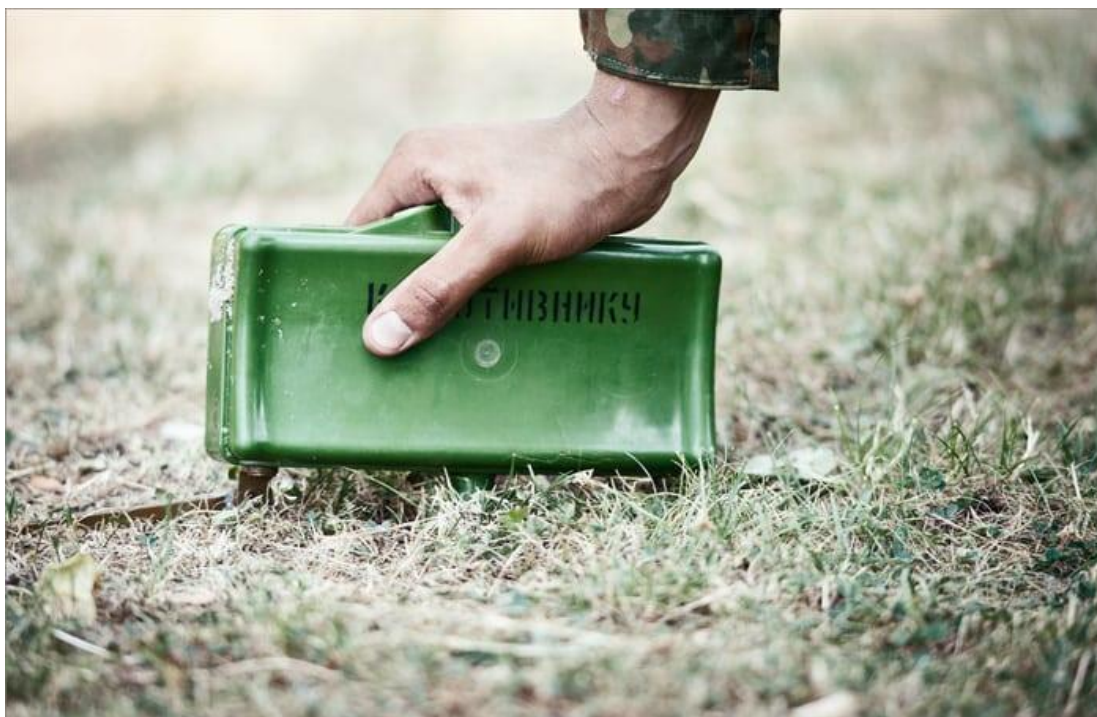
Мина в боевом положении