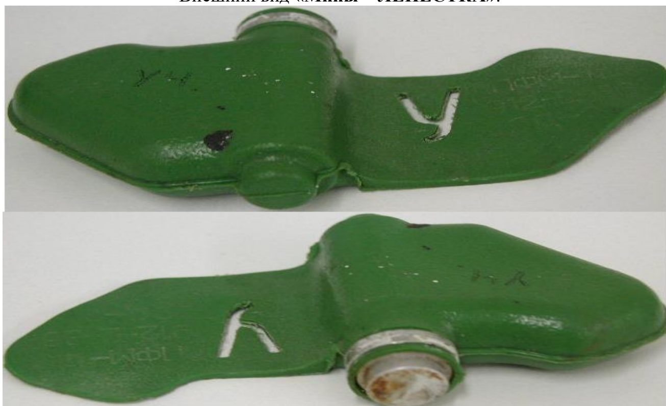
Внешний вид « Ми́ны – ЛЕПЕСТКА »:

Масса мины 80 грамм, размеры – 12 x 6 сантиметров, чувствительность мины лежит в пределах 5-25 кг, что вполне достаточно для срабатывания от веса маленького ребенка.